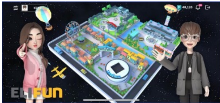
▲ E社 교육용 메타버스